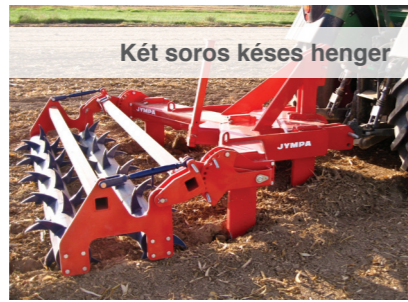
Két soros késes henger