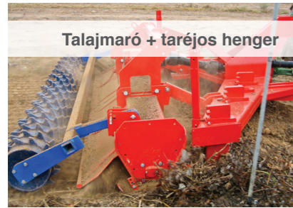
Talajmaró + taréjos henger