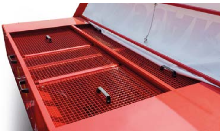
Setaccio (di serie su Montana F) Sieve (standard for Montana F) Sieb (standard für Montana F) Tamis (standard pour Montana F) Tamiz (standard para Montana F)