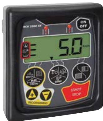
Tramline elettronico Electronic Tramline Elektronisch Fahrgassenschaltung Tramline électronique Tramline electrónico