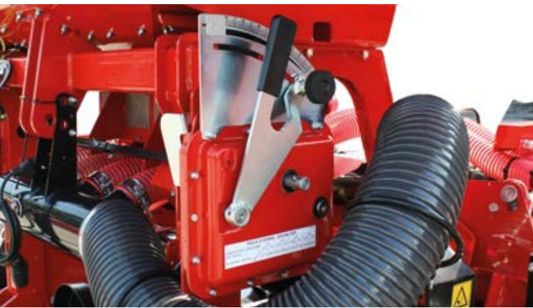
Variatore continuo a bagno d'olio Oil immersed gear box with continuous transmission Stufenloses Ölbadgetriebe Boite de vitesse à bain d'huile Variador continuo a baño de aceite