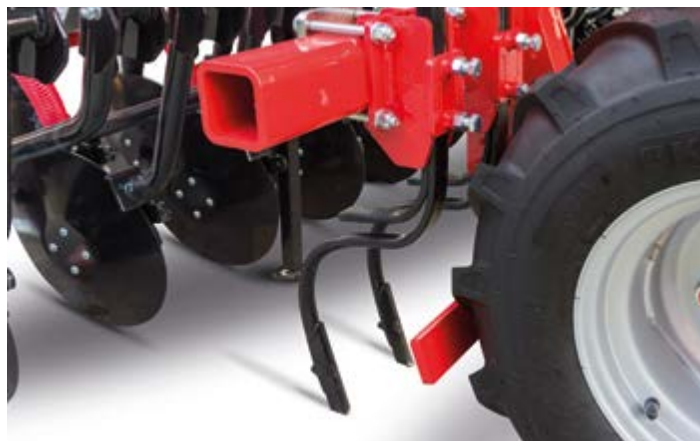
Rompitraccia Track eradicator Spurlockerer Effaceurs de traces Rompe surcos