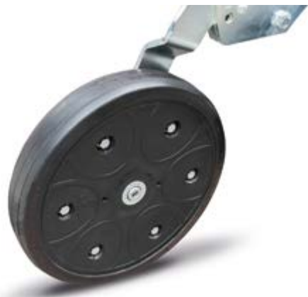
Ruotino posteriore per dischi doppi Rear wheels for double disc Rückrolle für Doppelscheibe Roue arriere pour disque double Rueda post.por doble disco