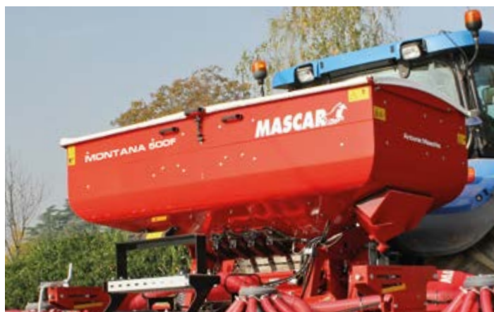
Rialzo tramoggia (500 L) Hopper extension (500 Lt.) Erhebungssatz der Saatbehälter (500 Lt.) Hausse tremie (500 L) Altura tolva (500 L)