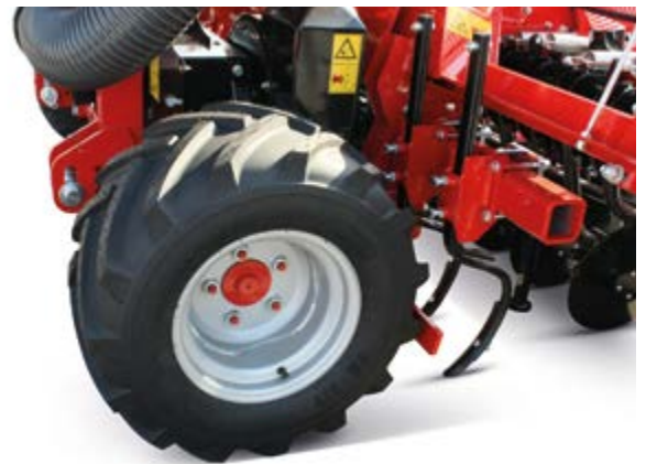
Ruote 26.00-12 26.00-12 wheels Räder 26.00-12 Roues 26.00-12 Ruedas 26.00-12