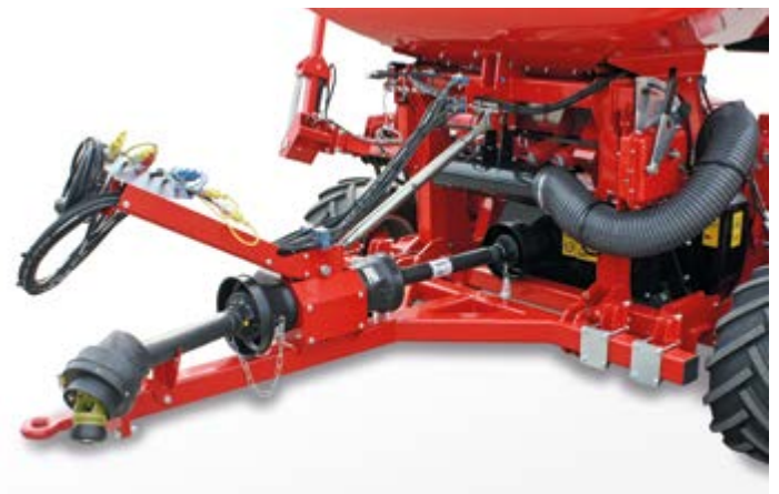
Traino Pull hitch Abschlepp Chariot Remolque