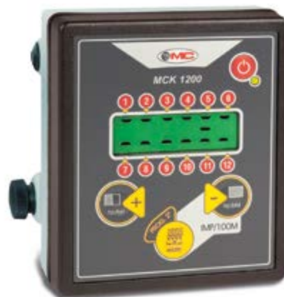
Controllo di semina Seeding control Samenkontrolle Contrôle de semis Control de semilla